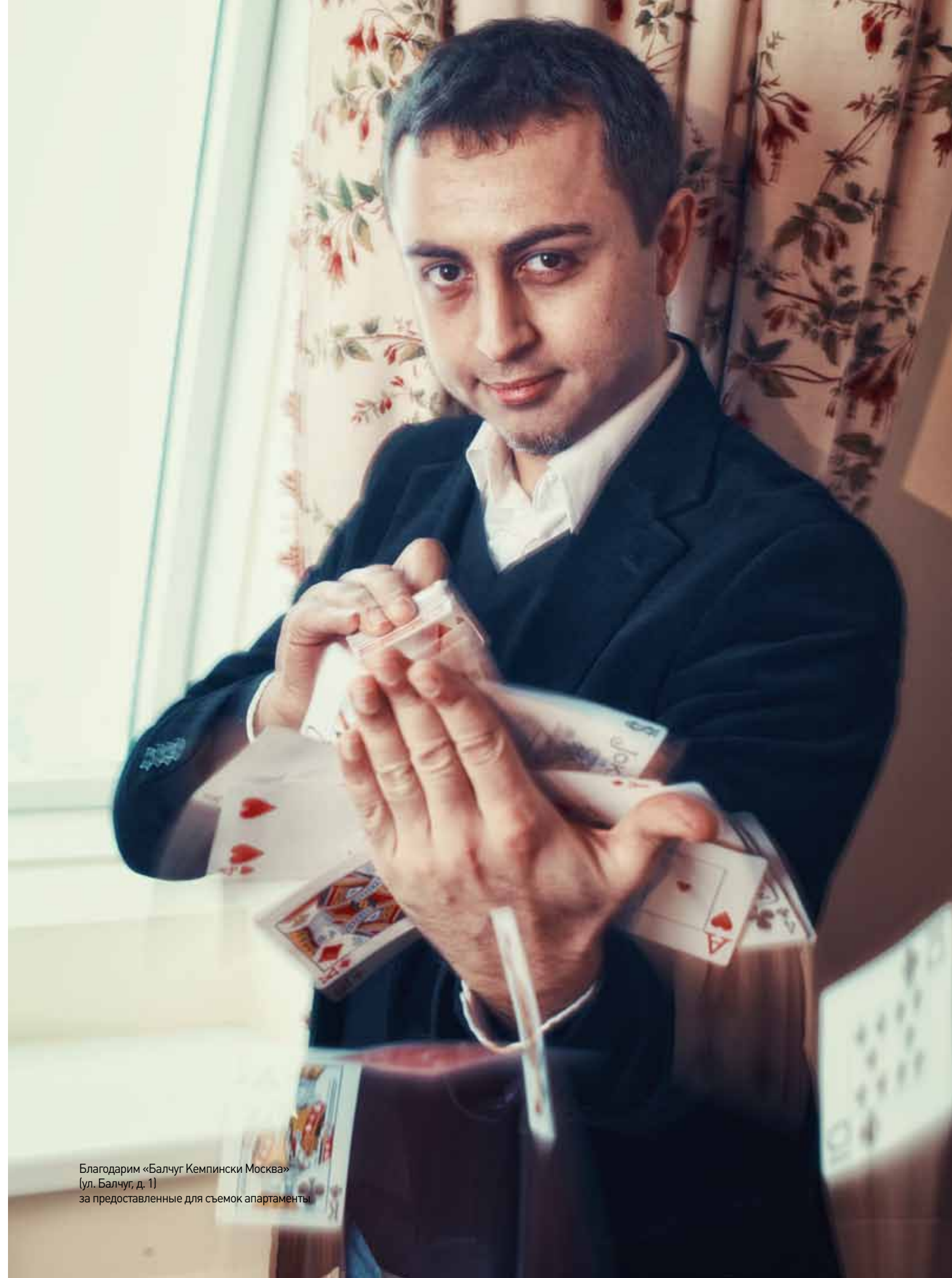
Благодарим «Балчуг Кемпински Москва» (ул. Балчуг, д. 1) за предоставленные для съемок апартаменты